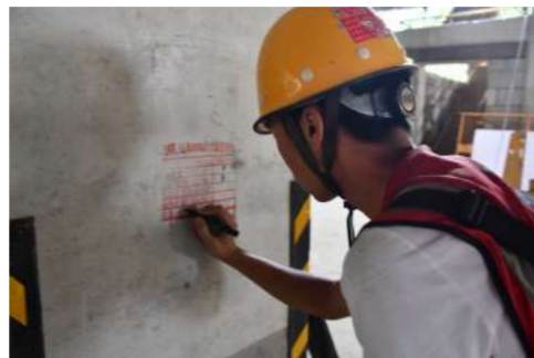
管理人员质检记录

在今后的工程建设中,项目部将继续坚持“百年大计、质量第一”的方针,严格执行工程质量有关法律法规和强制性标准,落实“以用户为中心的质量管理”理念,全力以赴,将新开普智能制造产业基地一期工程打造成“质量放心、合作顺心、使用舒心”的高品质工程!为公司高质量发展,提升公司质量竞争力贡献一份力量。(郑州分公司)