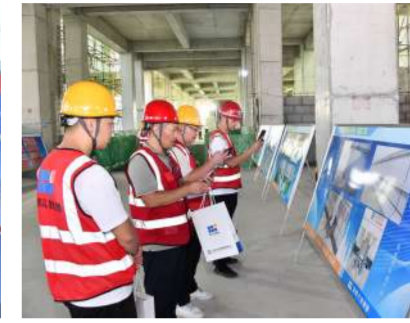
观看质量标准化图片