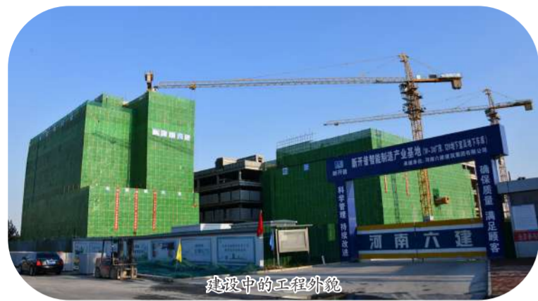
建设中的工程外景