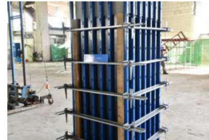
柱施工新工艺样板展示