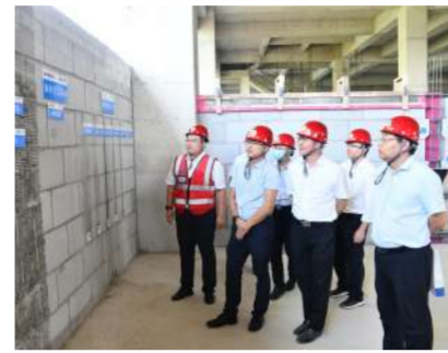
领导们参观砌体样板