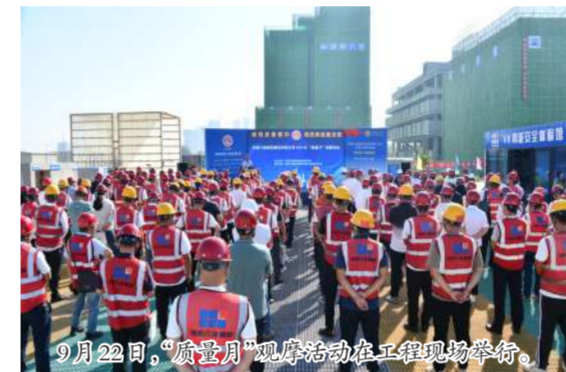
9月22日,“质量月”观摩活动在工程现场举行。