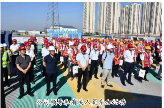
公司领导及有关人员参加活动