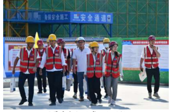
团员青年们观摩工程现场