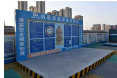
质量、安全教育宣讲台