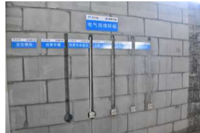
砌体安装实物样板