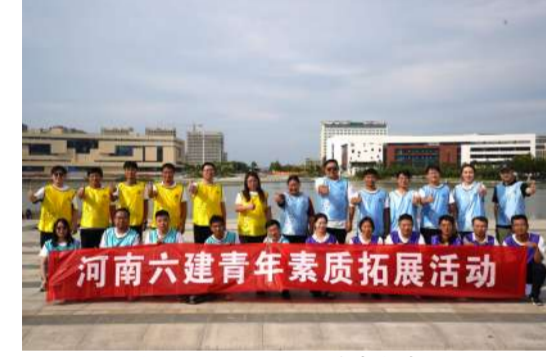
9月22日,集团公司开展迎双节青年素质拓展活动