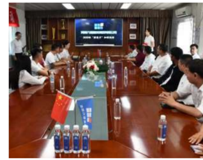
质量知识竞赛活动