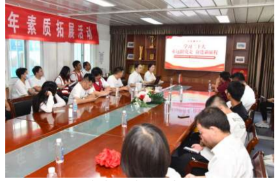
党建、团建知识学习