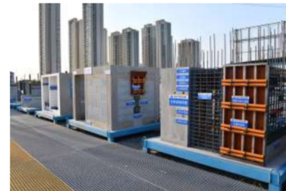
工程质量样板展示区