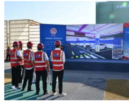
观看质量技术交底视频