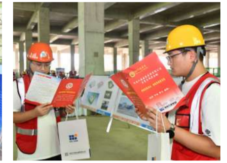
阅读集团公司“质量月”活动宣传手册