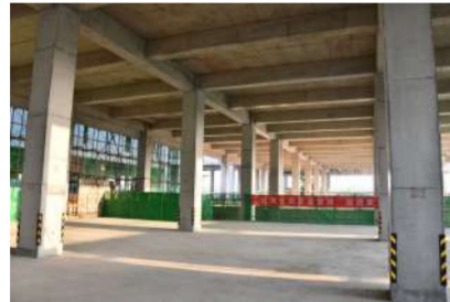
工程实体质量观感良好