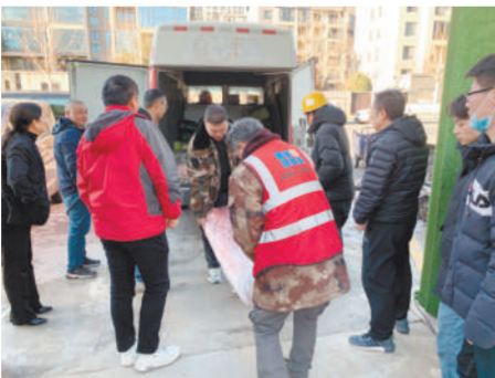
将慰问品送到天澜花园项目一线员工手中