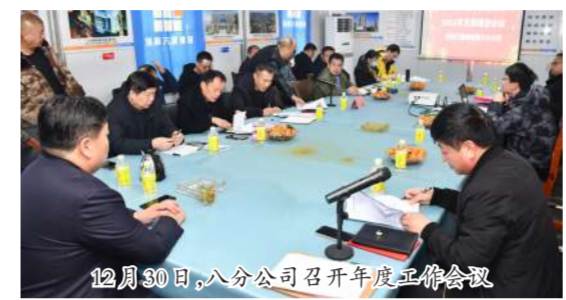
12月30日,八分公司召开年度工作会议