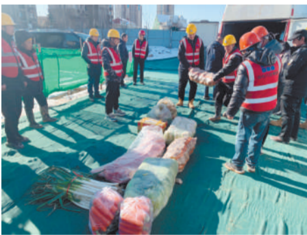
在云湖上郡项目慰问一线员工

有关人员详细了解了工程建设情况,并叮嘱项目人员做好冬季施工安全及劳动保护工作,高度重视一线员工身心健康和生命安全。现场员工高兴地接过慰问品,对集团公司的关怀表达了衷心感谢,并表示将不辜负公司领导的关爱,鼓足干劲,全力以赴完成建设任务。(工会)