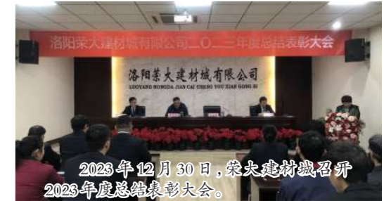
2023年12月30日,荣大建材城召开2023年度总结表彰大会。

岁序更替,华章日新。我们跨越2023年重重困难,迎来了新的起点、新的挑战、新的机遇。路虽远,行则将至;事虽难,做则必成。我们坚信,在集团公司的坚强领导下,名优人将聚焦公司既定的各项目目标,团结一心、真抓实干、开拓进取、勇于创新,为实现明年各项工作目标,继续做出我们新的更大的贡献!(名优建材家居广场)