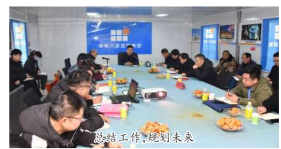
总结工作,规划未来