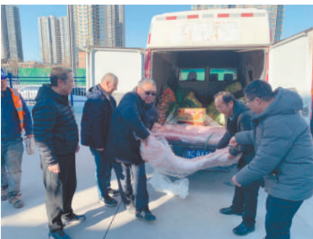
在玄武门大街项目送上慰问品