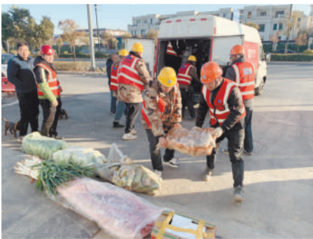
在都会龙园项目,员工们高兴地接过慰问品